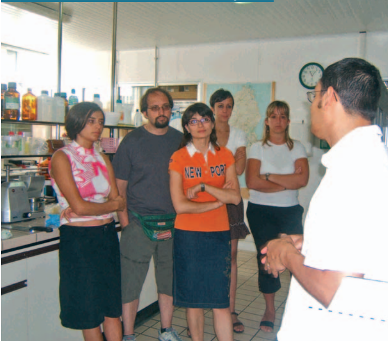
visita all'azienda casearia F.Ili Pinna, Thiesi (Sardegna)