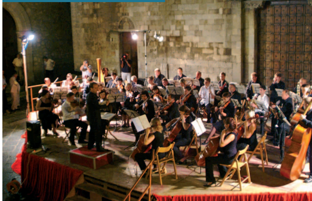
concerto dell'orchestra Filarmonica Russa "Karelia"